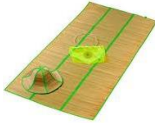
a esteira de vime a esteira de praia