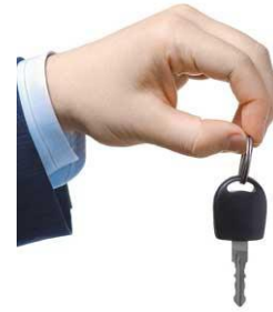
Carlos comprou um carro novinho em folha!