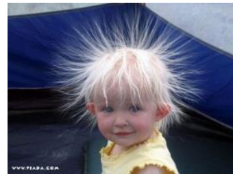
o arrepio a pele arrepiada o cabelo arrepiado